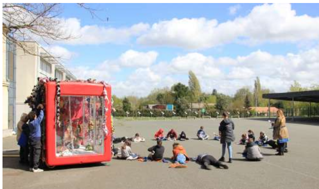
Atelier dans l'espace public à Saint-Yzan-de-Soudiac, exposition "Made in/Made/on" de Duda Moraès avec des élèves du collège de la commune. 2022