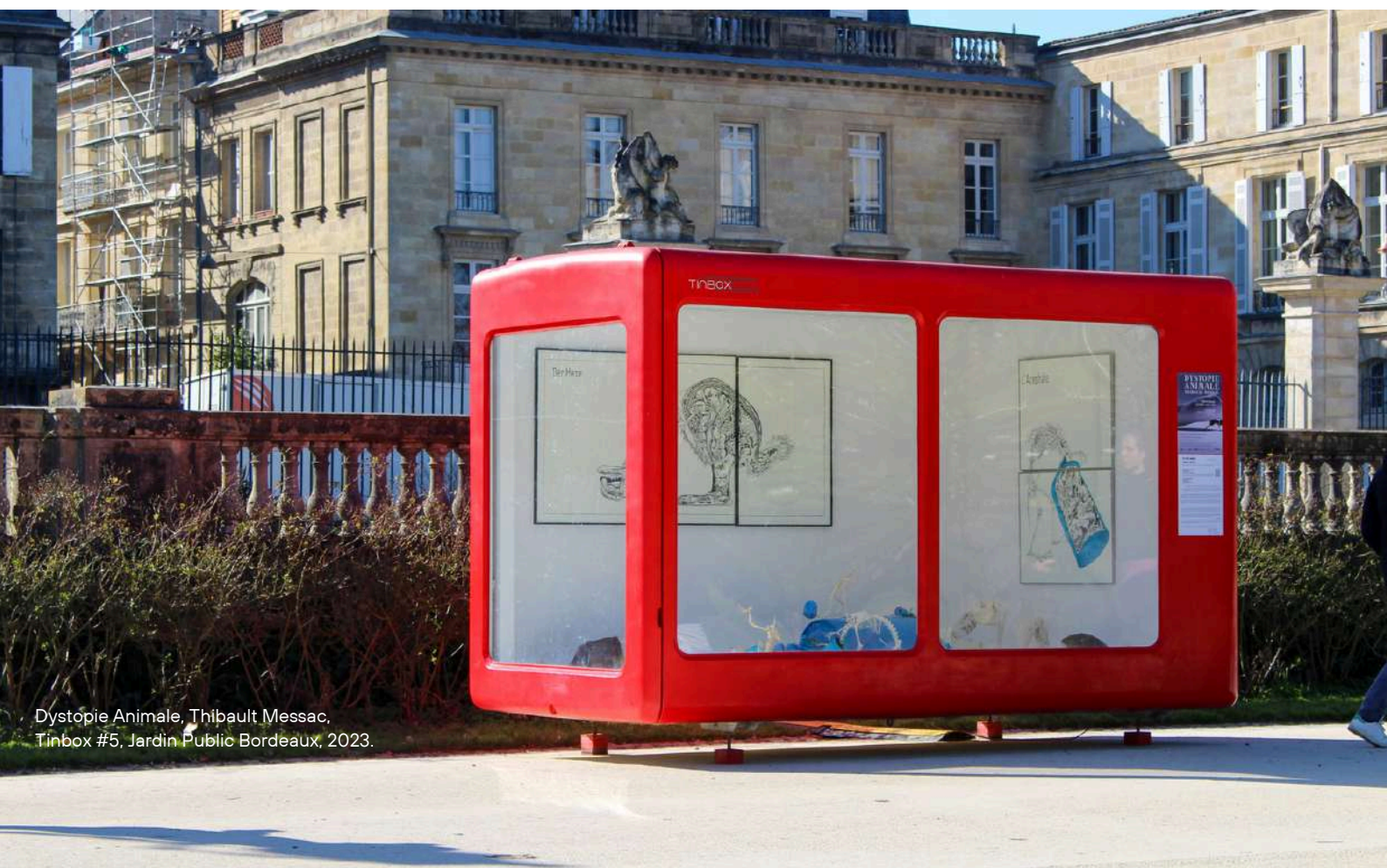
Dystopie Animale, Thibault Messac, Tinbox #5, Jardin Public Bordeaux, 2023.

Topos d'exposition nomade, aux dimensions atypiques, elle peut s'installer dans des territoires et des espaces pluriels, de la rue aux lieux d'art, en passant par les écoles, les entreprises, les centres sociaux, les hôpitaux... Cette faculté de diffusion nomade en fait un outil de diffusion et d'échange original sur la scène artistique. Tinbox peut en effet être présente partout, pour aller à la rencontre des individus. C'est ainsi un vecteur de partage de l'art contemporain, généreux et exigeant dans ses choix comme dans ses modes de valorisation et d'exposition des œuvres.