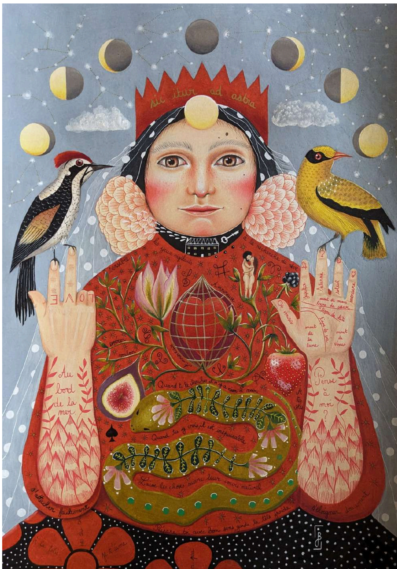
Au bord de la mer, 2024

Dessin au crayon de couleur sur papier canson 200g 42 x 59,4 cm