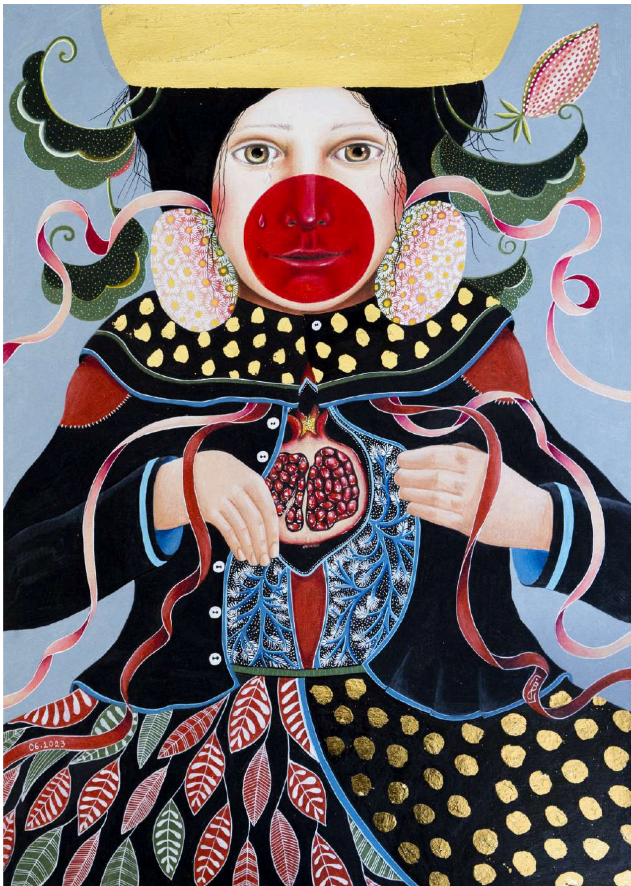
Reine dorée n°2 Grenade , Juin 2023

Crayon de couleur, peinture acrylique blanche et feuille d'or sur papier canson 200g 42 x 59,4cm