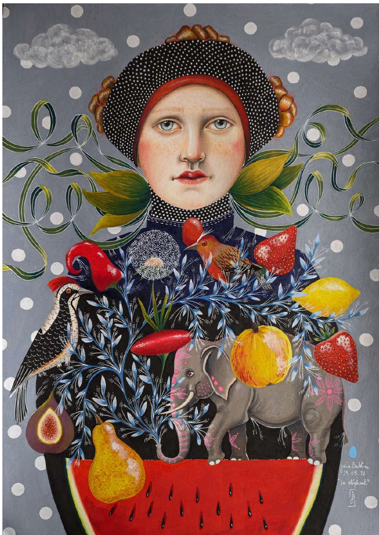
Elephant , 2024

Dessin au crayon de couleur sur papier canson blanc 42 x 59,4 cm