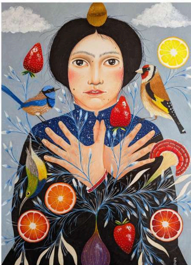
Mudra , 2025 Série de 4 dessins au crayon de couleur sur papier canson blanc 200g 42 x 59,4 cm