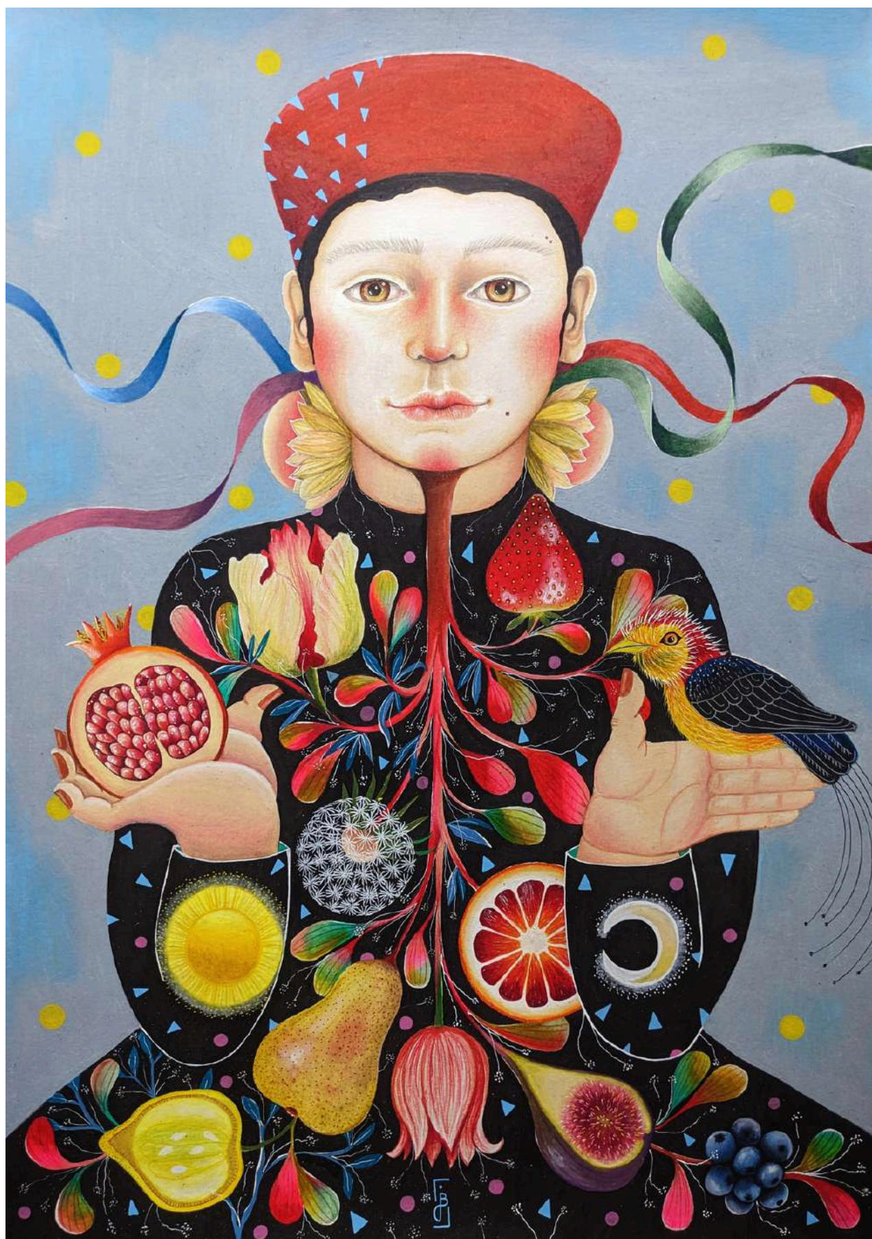
Sans titre, 2023

Dessin au crayon de couleur sur papier canson 200g 42 x 59,4 cm