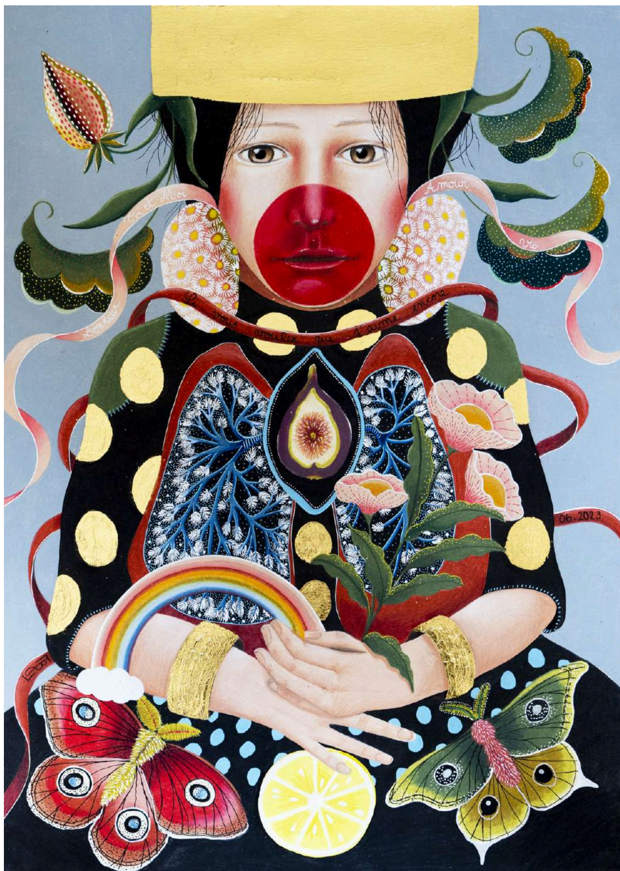
Reine dorée n°1 Poumons , Juin 2023

Crayon de couleur, peinture acrylique blanche et feuille d'or sur papier canson 200g 42 x 59,4cm