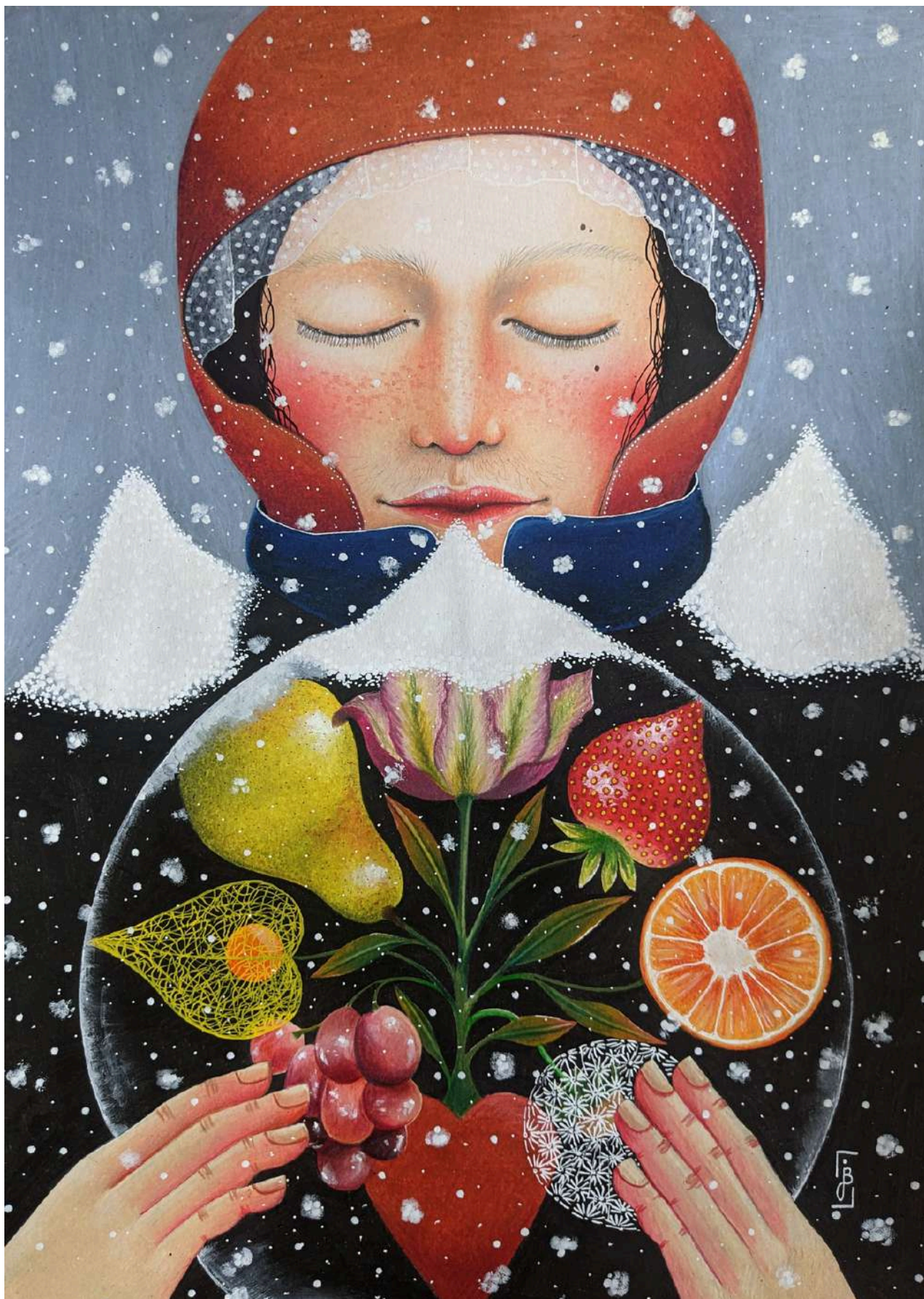
Au cœur de l'hiver, 2024 Dessin au crayon de couleur sur papier canson blanc 200g 42 x 59,4 cm