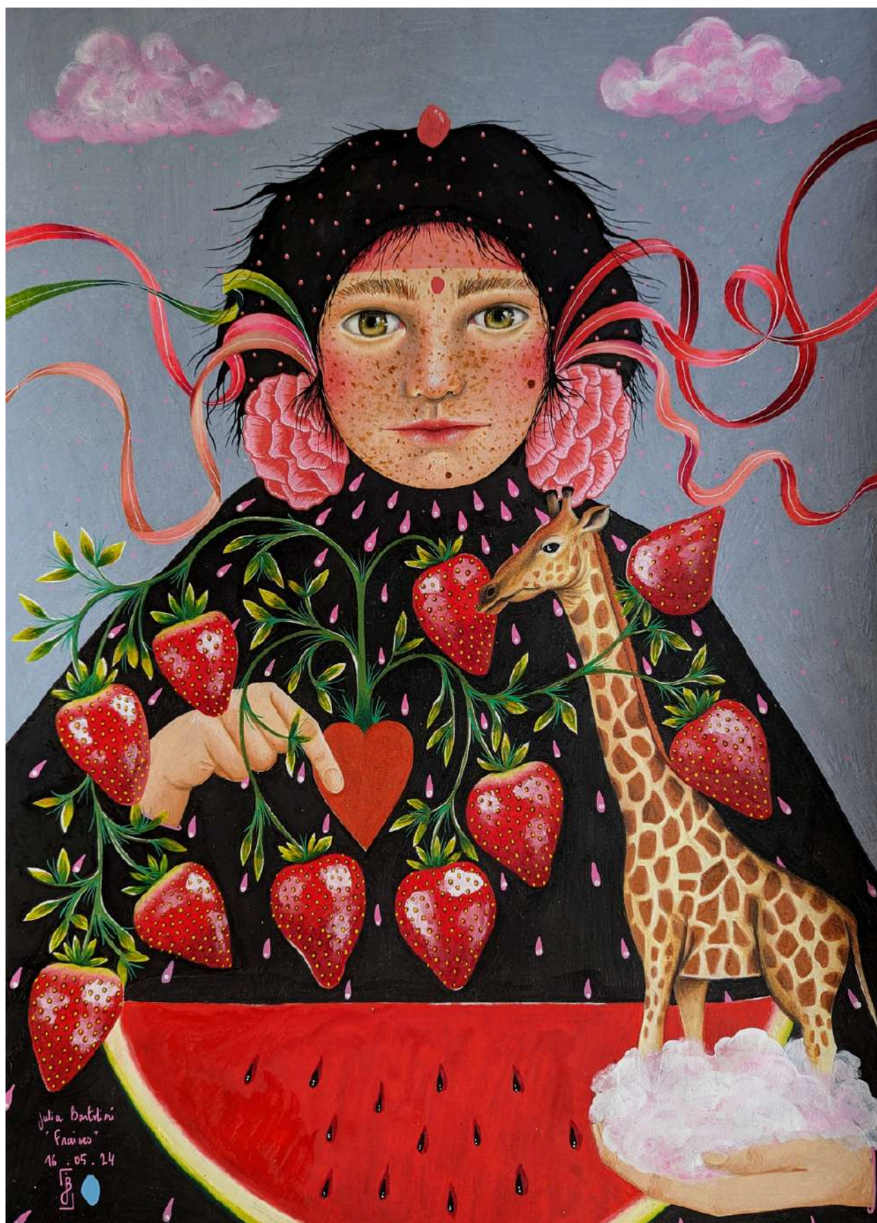
Girafe , 2024 Dessin au crayon de couleur sur papier canson 200g 42 x 59,4 cm