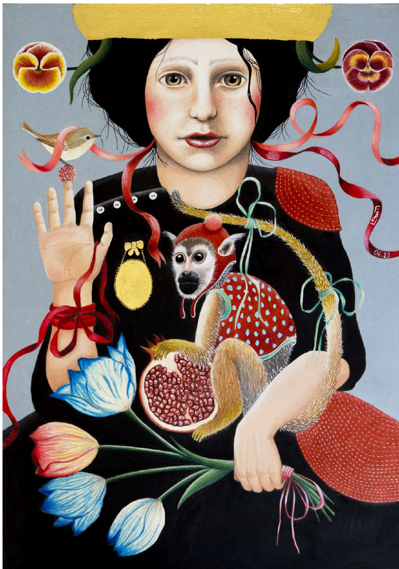
Reine dorée n°3 Singe , Juin 2023

Crayon de couleur, peinture acrylique blanche et feuille d'or sur papier canson 200g 42 x 59,4cm