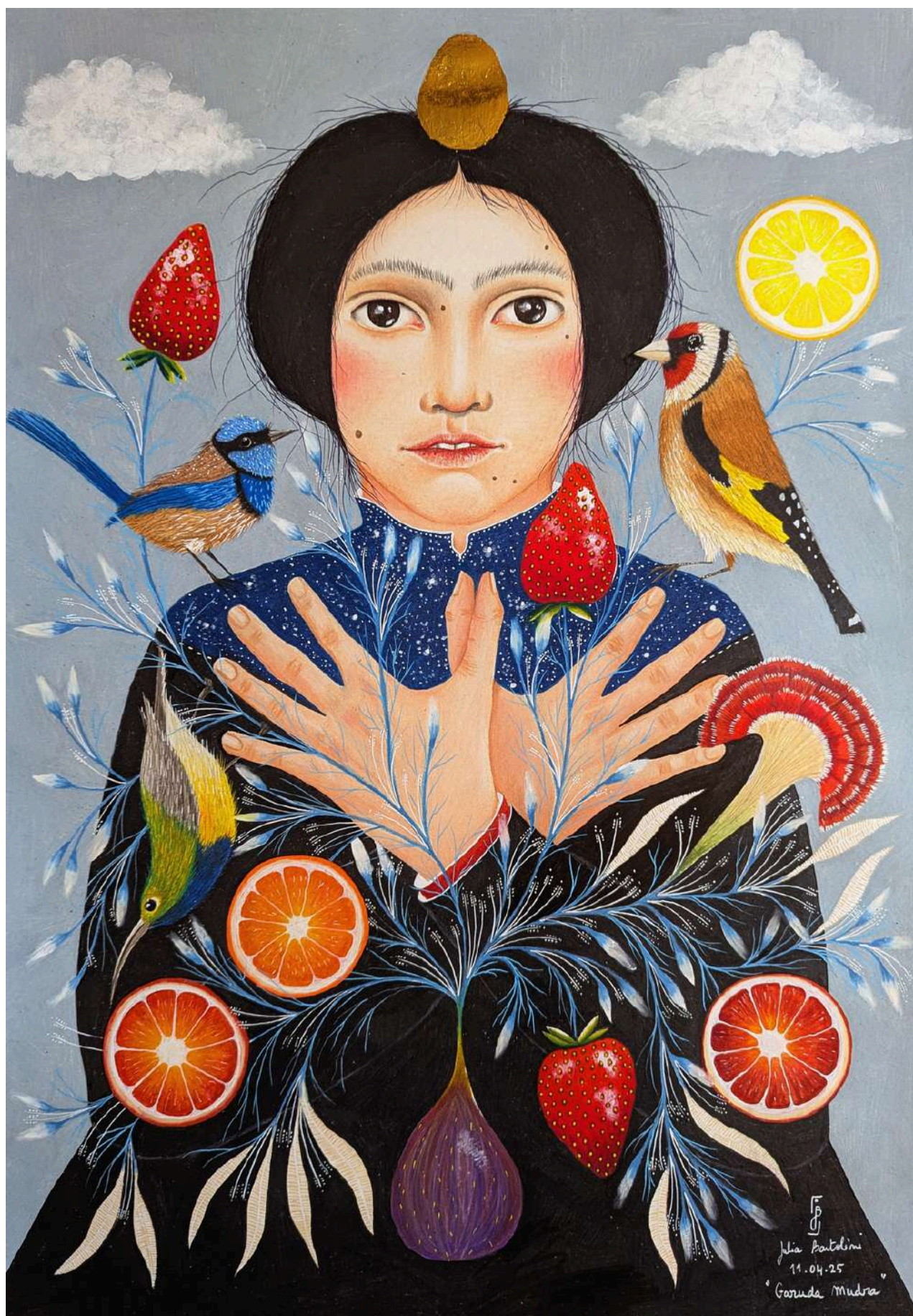
Garuda mudra, 2025

Dessin au crayon de couleur sur papier canson 200g 42 x 59,4 cm