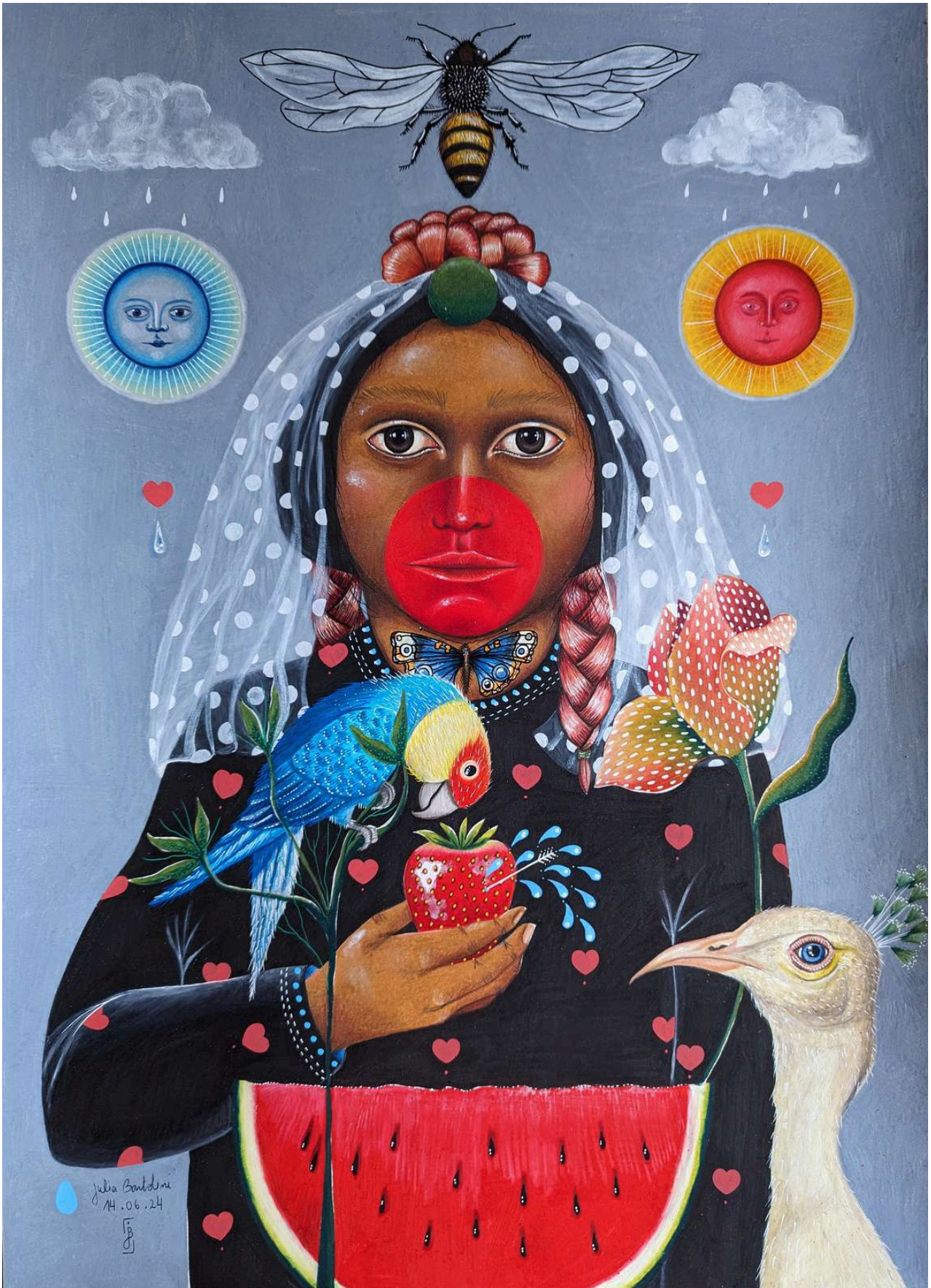
Paon blanc, 2024 Dessin au crayon de couleur sur papier canson blanc 200g 42 x 59,4 cm