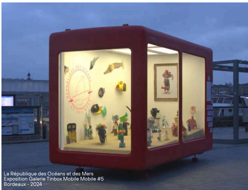
La République des Océans et des Mers Exposition Galerie Tinbox Mobile #5 Bordeaux - 2024

Expositions itinérantes, vernissages, visites, parcours EAC et ateliers de pratiques artistiques se déploieront toute l'année en collaboration et dans 7 communes pour une durée de 3 à 4 semaines par site d'implantation: dans les Landes et en Gironde en Nouvelle-Aquitaine.