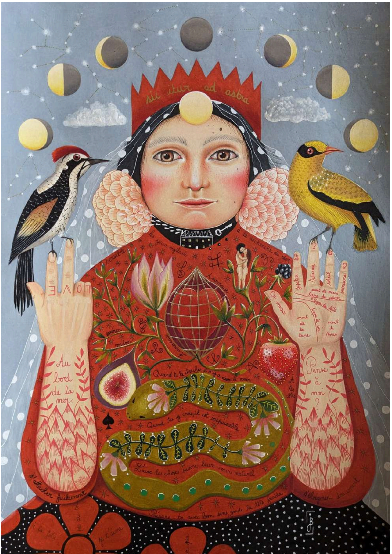
Au bord de la mer , 2024 Dessin au crayon de couleur sur papier canson 200g 42 x 59,4 cm