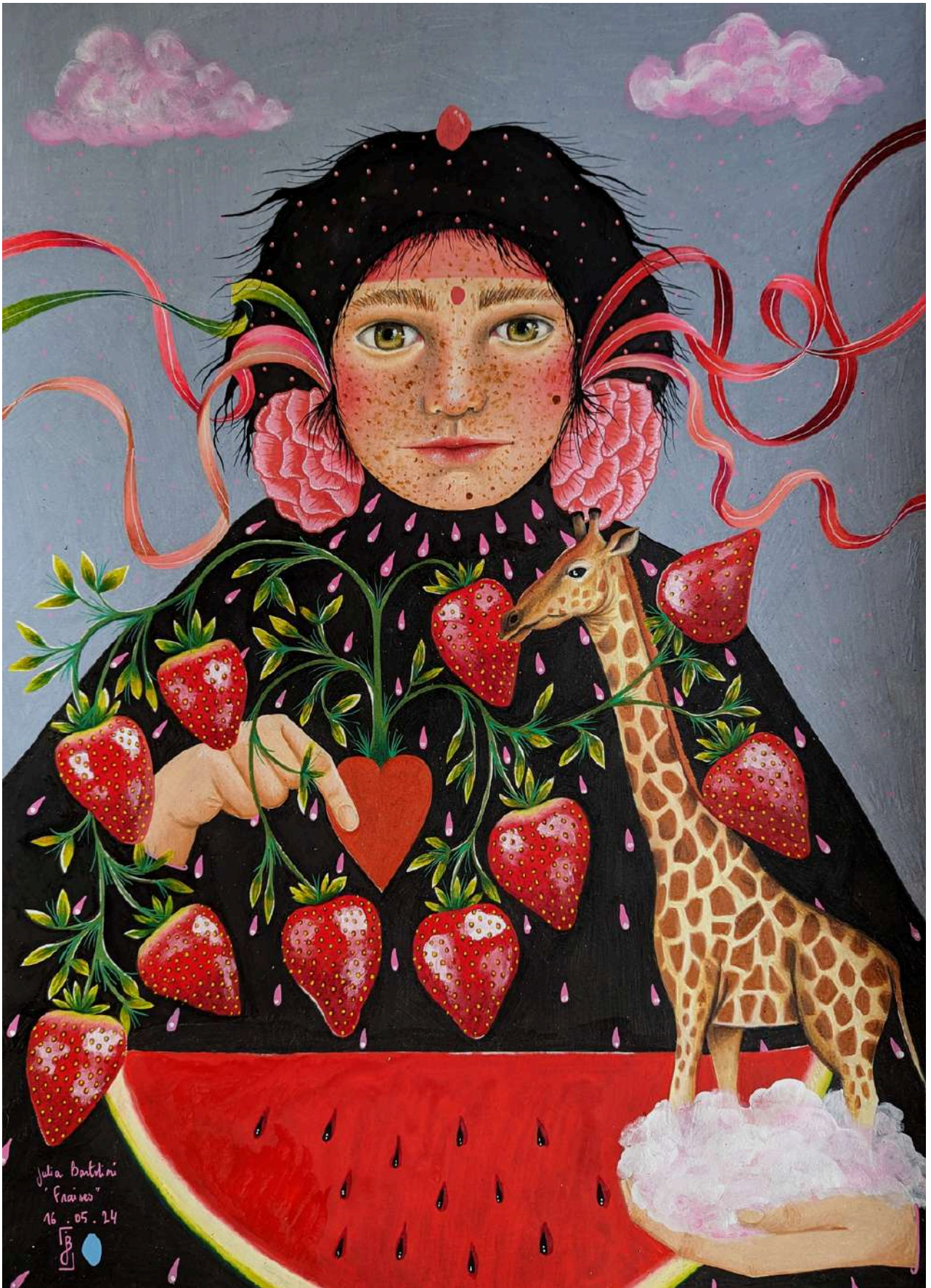
Girafe , 2024 Dessin au crayon de couleur sur papier canson 200g 42 x 59,4 cm