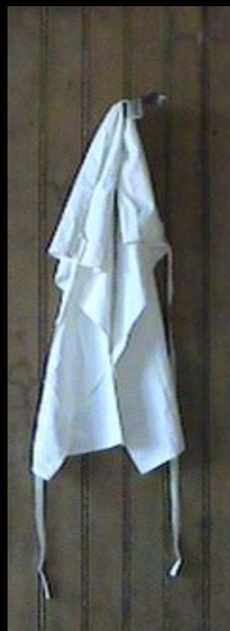
Installation 2009 Tablier planté par un couteau de cuisine sur une porte en bois brut sortie de ses gonds.