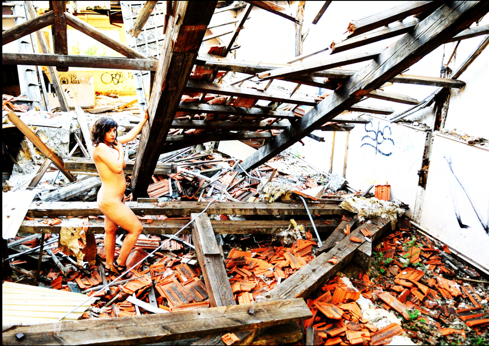
Destroyed home 2011 Photographie couleur contrecollée sur Dibbon 79cm x 1,15m