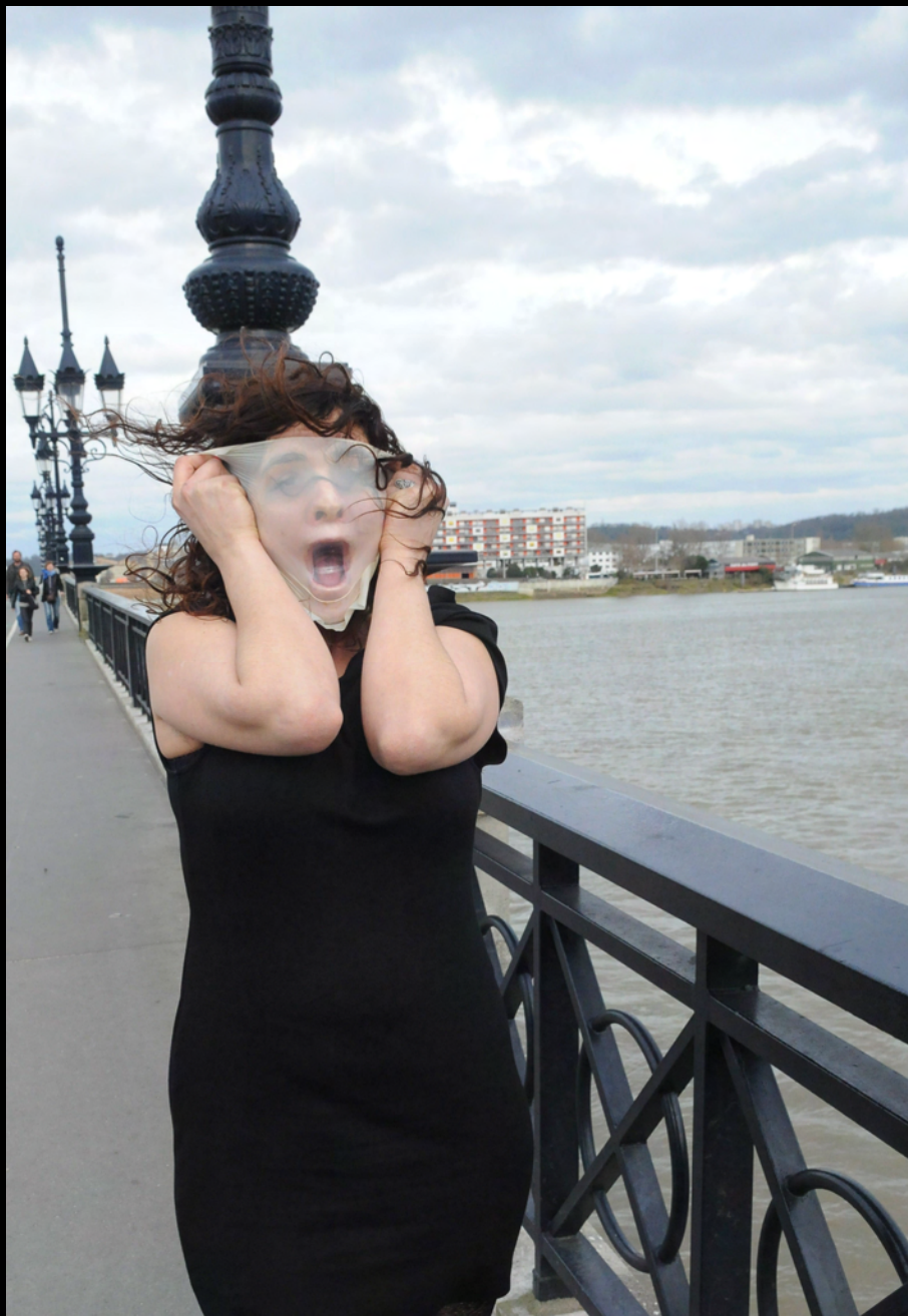
Le cri 2013 Photographie couleur carré de latex.