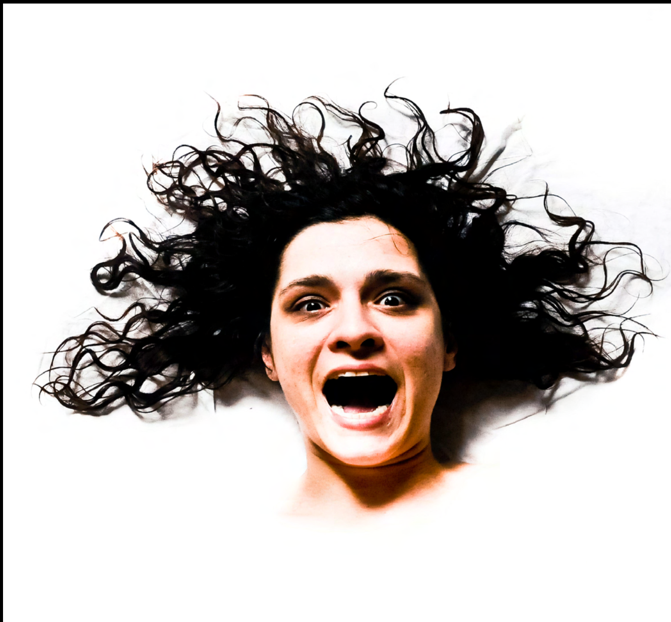
Sans titre 2013 Photographie couleur 50x50cm