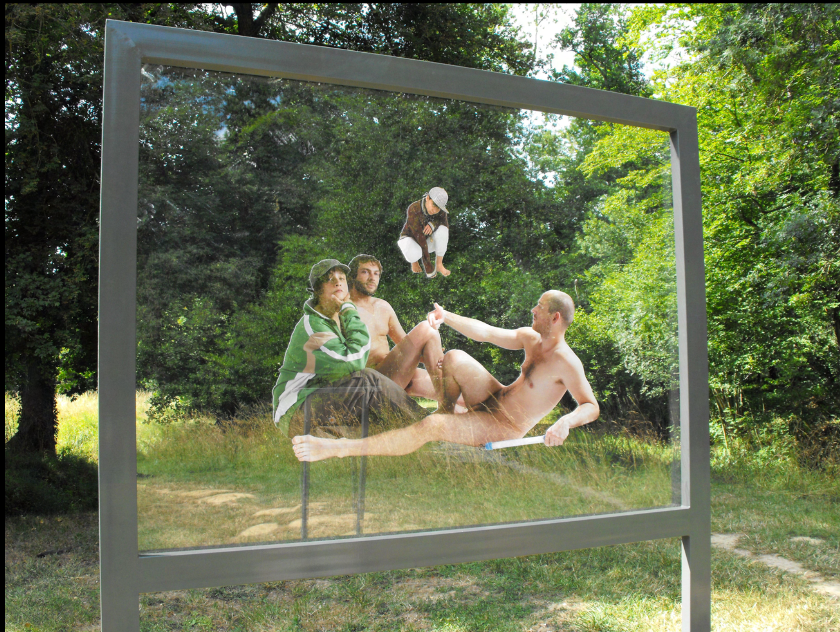
Déjeuner sur l'herbe 2 2011 Installation dans le cadre des rencontres d'art et paysage d'Artigues -prés-Bordeaux Cadre en acier ,deux plaque de plexiglas, photographie détournée 1,90x2,40m