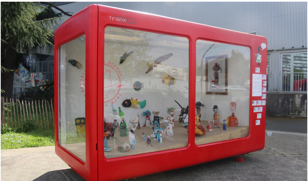
République des Océans et des Mers, Le petit PARC, quartier du Grand Parc, 2024.