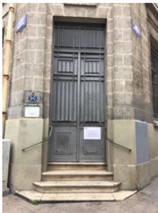
Photographies de la façade du SAMU social Porte d'entrée cours de la Marne

« L'UTILISATION DE L'ESPACE PUBLIC À DES FINS ARTISTIQUES EST ESSENTIELLE CAR ELLE PERMET AUX PERSONNES, Y COMPRIS, AUX PERSONNES MARGINALISÉES, D'ACCÉDER LIBREMENT AUX ARTS, Y COMPRIS DANS LEURS FORMES LES PLUS CONTEMPORAINES ET PARFOIS D'Y PARTICIPER. »