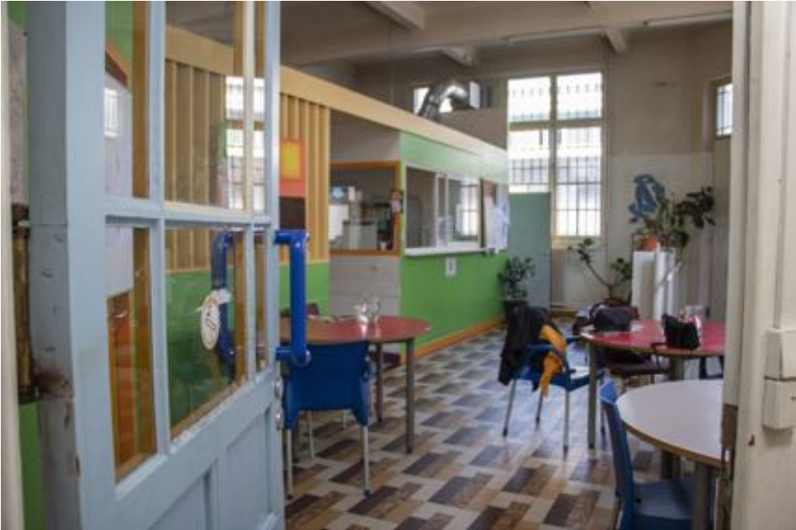
Hall + vue sur accueil - SAMU social