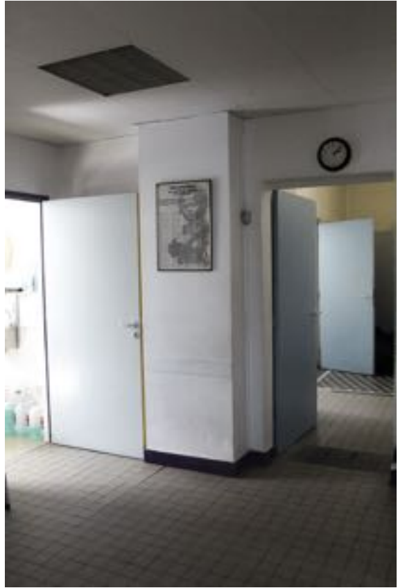
Coulloir - SAMU social