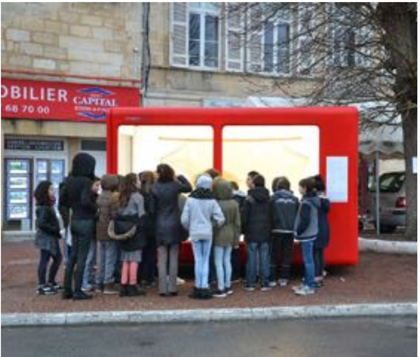
« LE SAUT DU LAPIN » / Anne-Marie Durou / Galerie Tinbox Mobile / Classe de 6ème et leur enseignante en Arts Plastiques / Collège Jacques Prévert / Bourg / 2017

L'Agence Créative réunit en une même entité l'ensemble des métiers et des acteurs agissant pour la diffusion de l'art contemporain. Son fonctionnement lui permet de ne s'interdire aucun mode d'écriture, de monstration ou de partage de l'art. Elle collabore ainsi avec des citoyens, des artistes, des structures culturelles, des critiques d'art, des commissaires d'expositions, des associations ou encore des entreprises pour mener à bien des projets curatoriaux créatifs et participatifs. Les expositions, événements, ateliers ou rencontres qu'elle organise peuvent se dérouler dans des espaces ou des contextes très variés dédiés ou non à l'art.