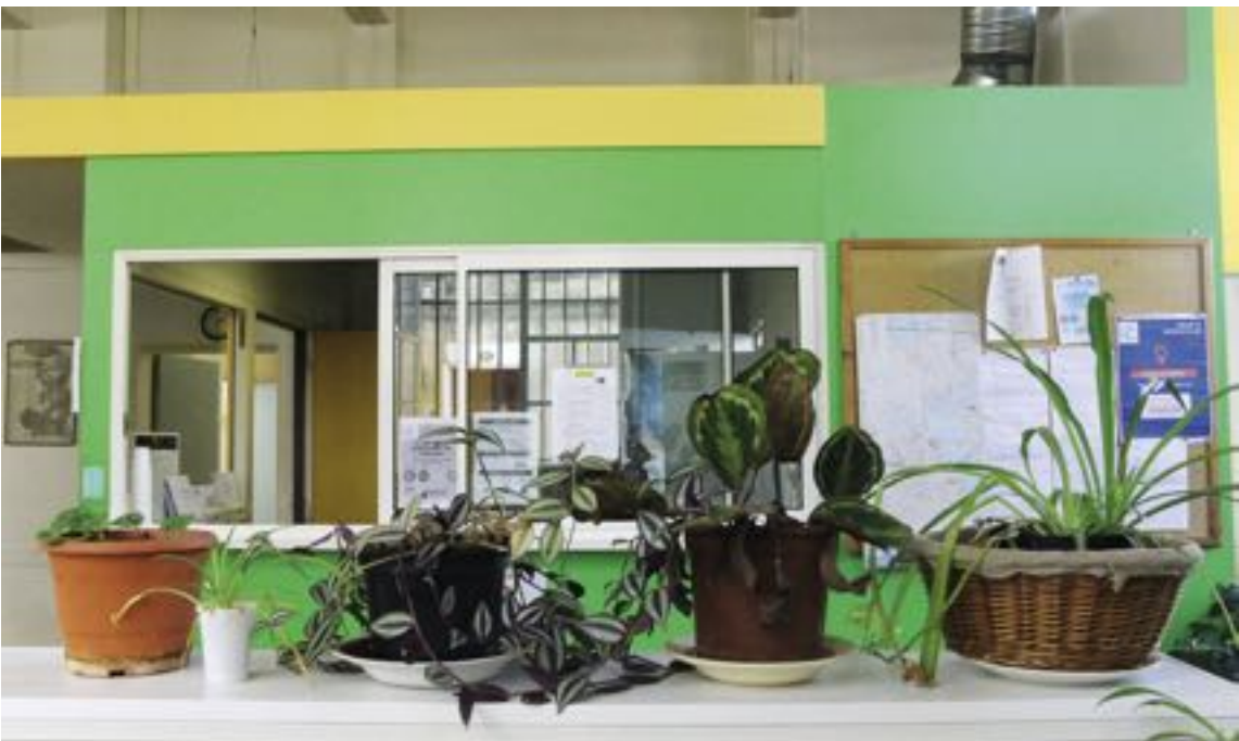
Hall + vue sur accueil - SAMU social