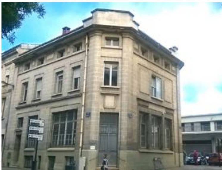
Façade du SAMU social

L'objectif du SAMU Social est d'aller à la rencontre des personnes sans-abri, afin de favoriser leur accès aux dispositifs de droit commun.