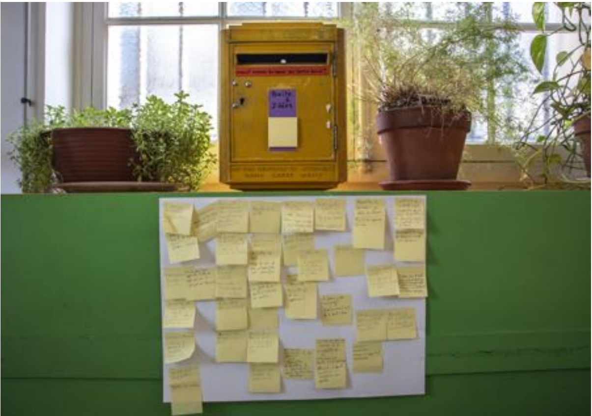
Boîte à idées