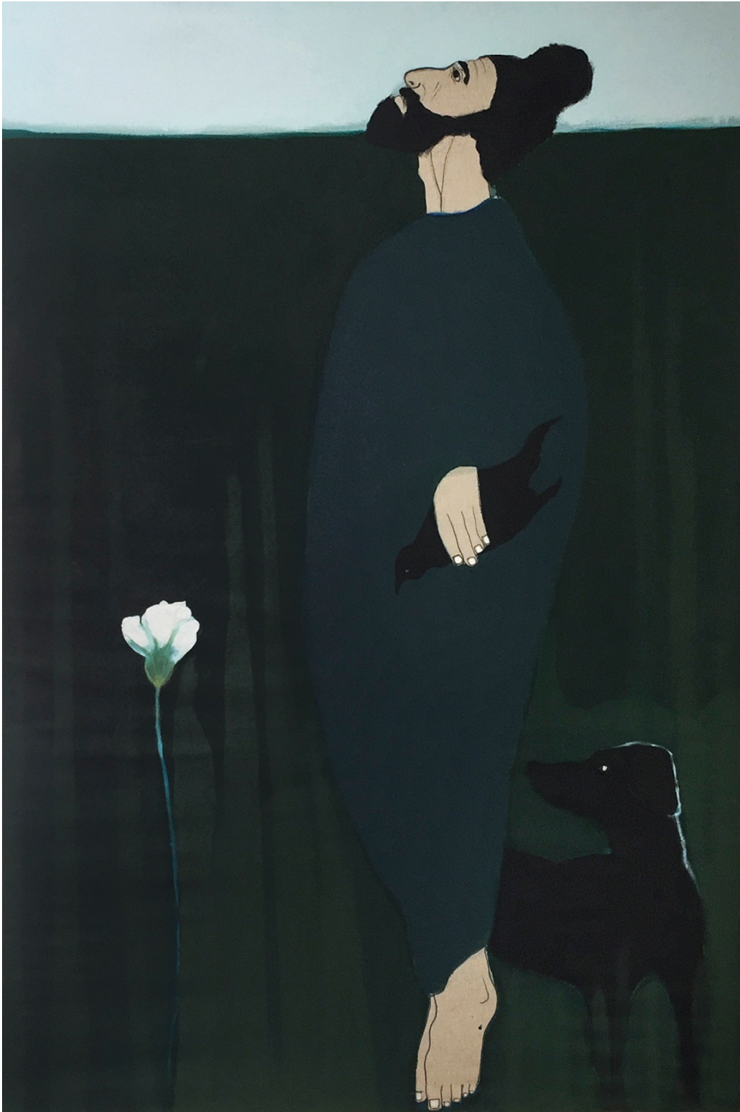
« Escaping black bird », 2018, acrylique sur toile, 115 x 180 cm