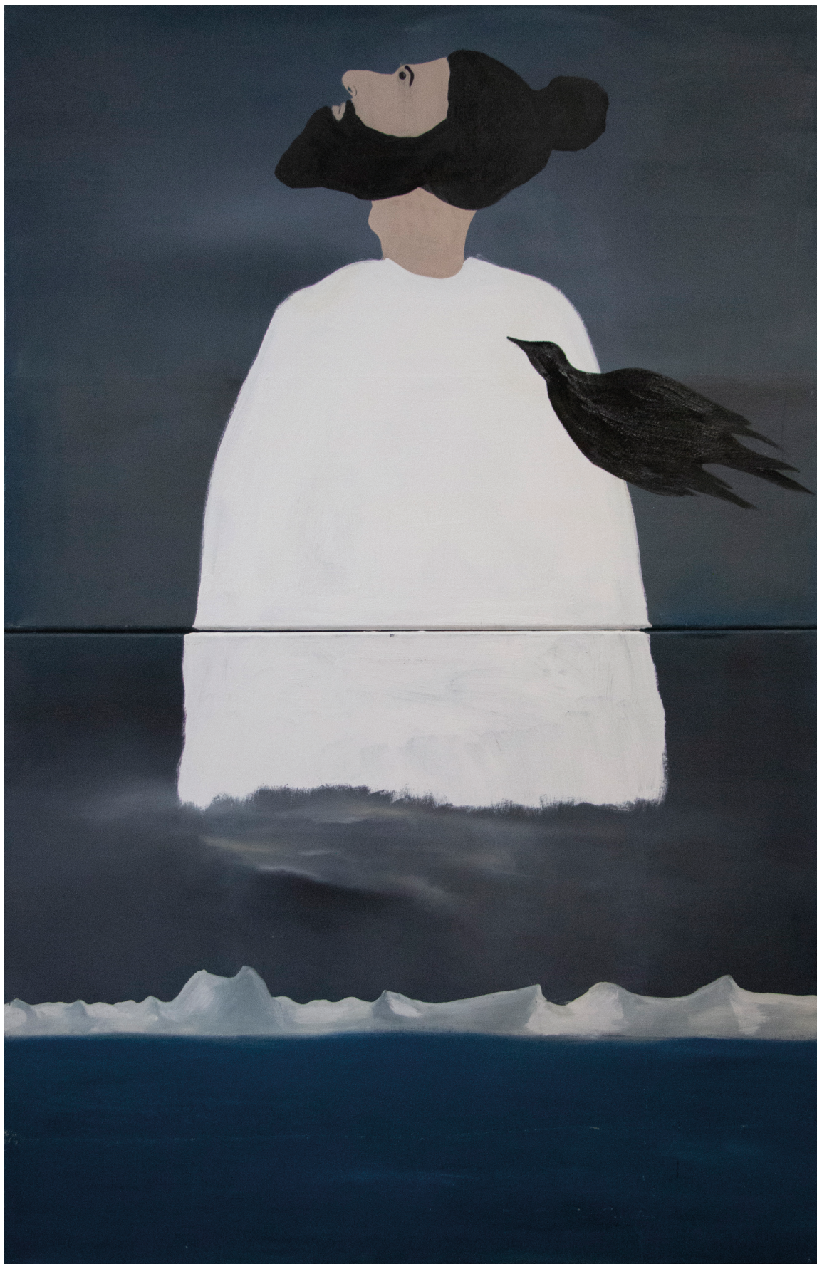
« Escaping black bird », 2018, acrylique sur toile, 115 x 180 cm