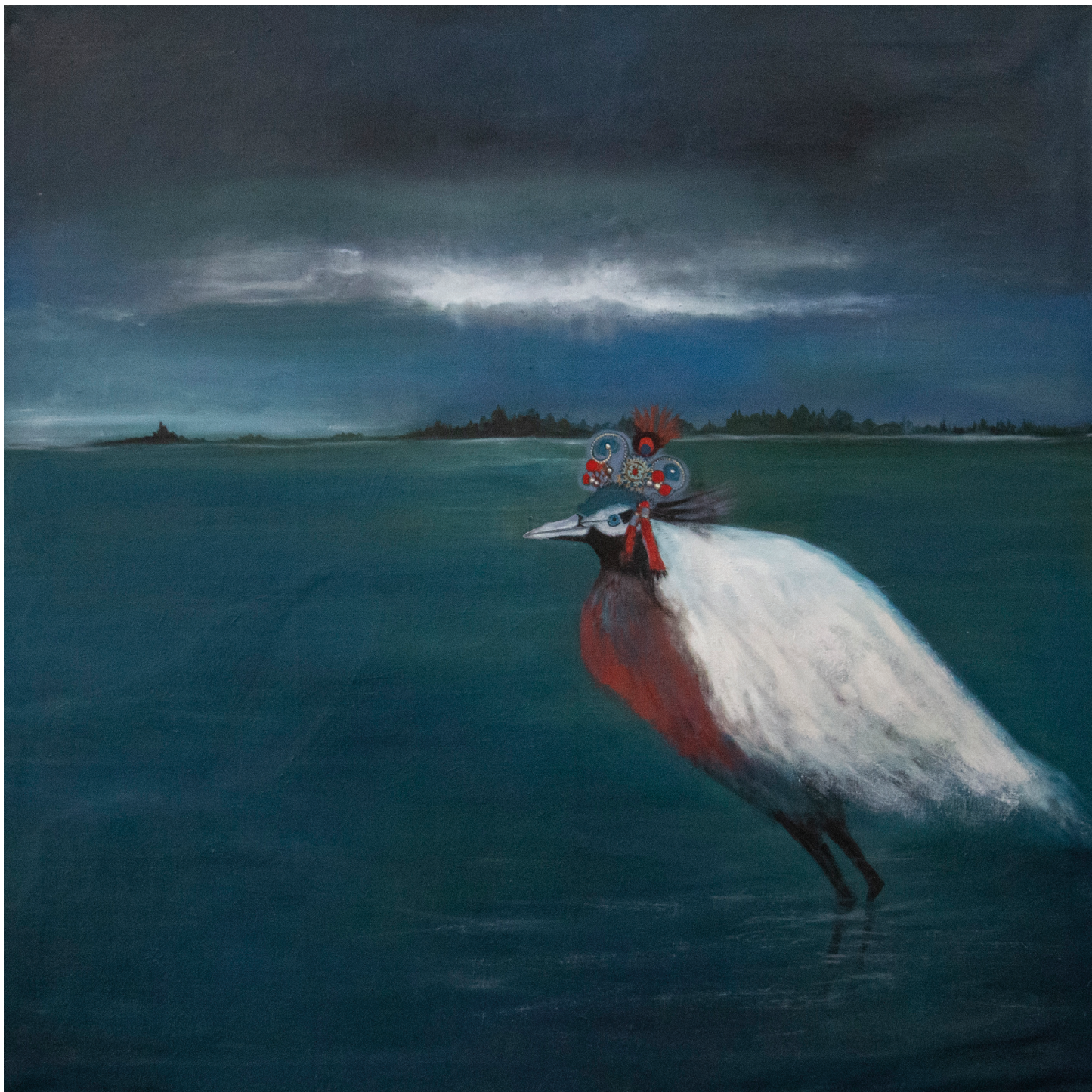
« L'estuaire exotique », 2013, huile sur toile, 150 x 150 cm