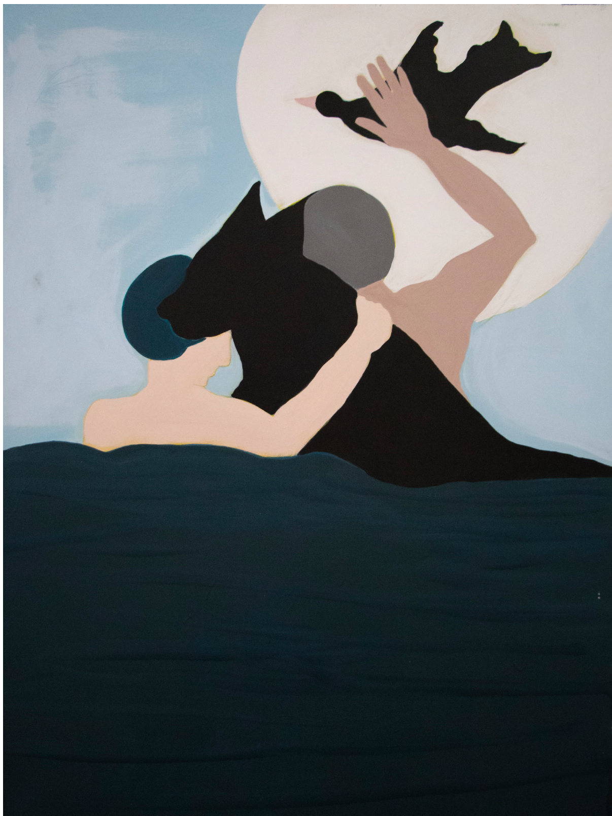
« Full moon », 2018, acrylique sur toile, 120 x 160 cm