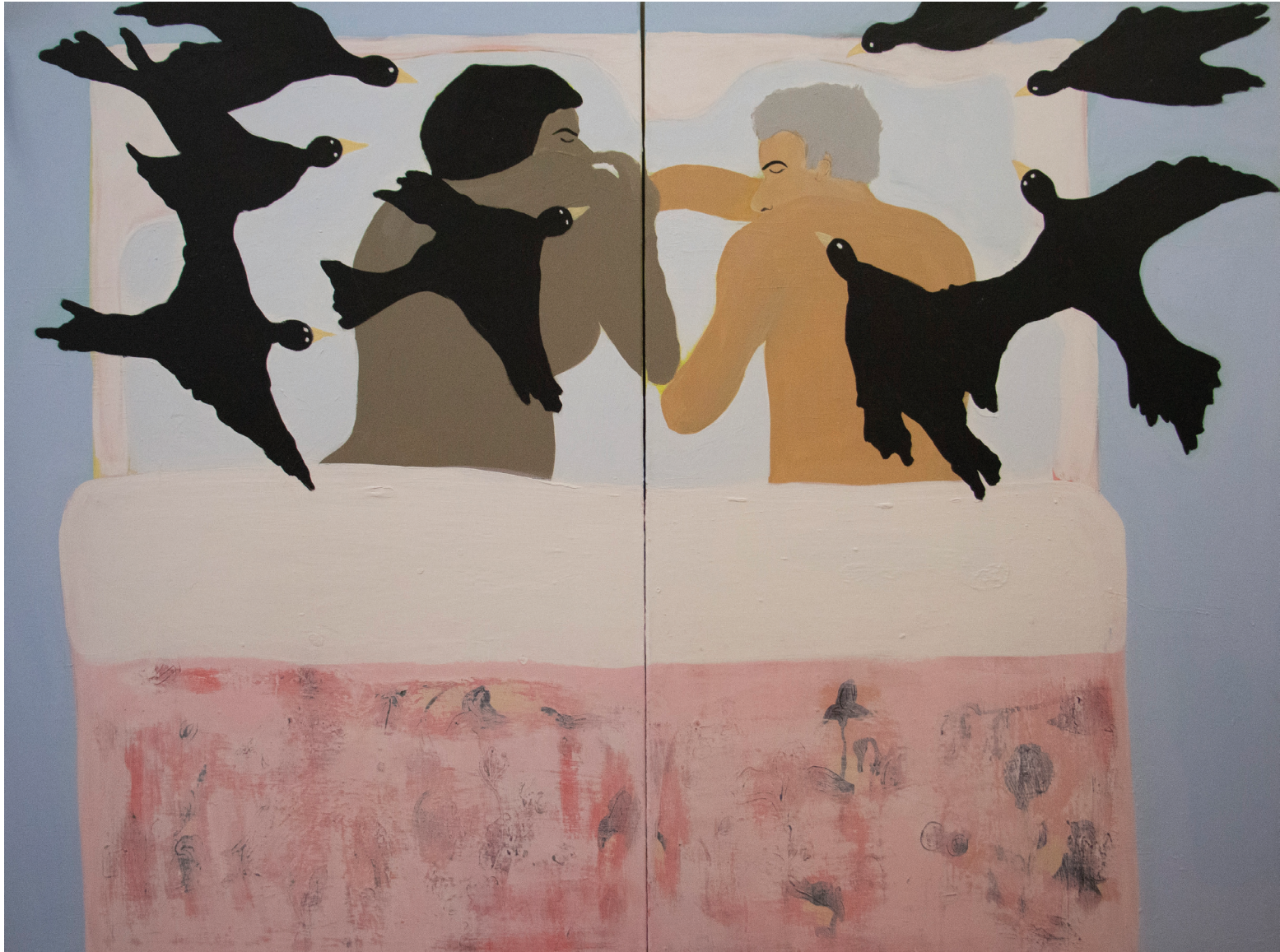
« Dream », 2018, huile sur toile, 100 x 150 cm