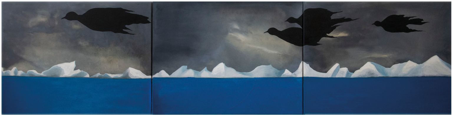
« Black birds », 2017, acrylique sur toile, 348 x 267 cm