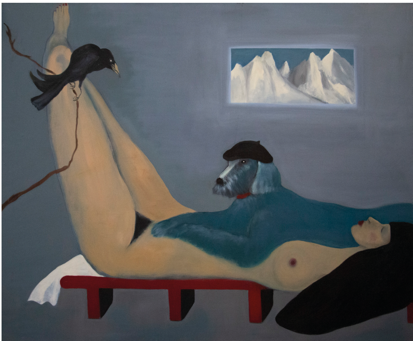
« Béret basque », 2012, huile sur toile, 170 x 140 cm