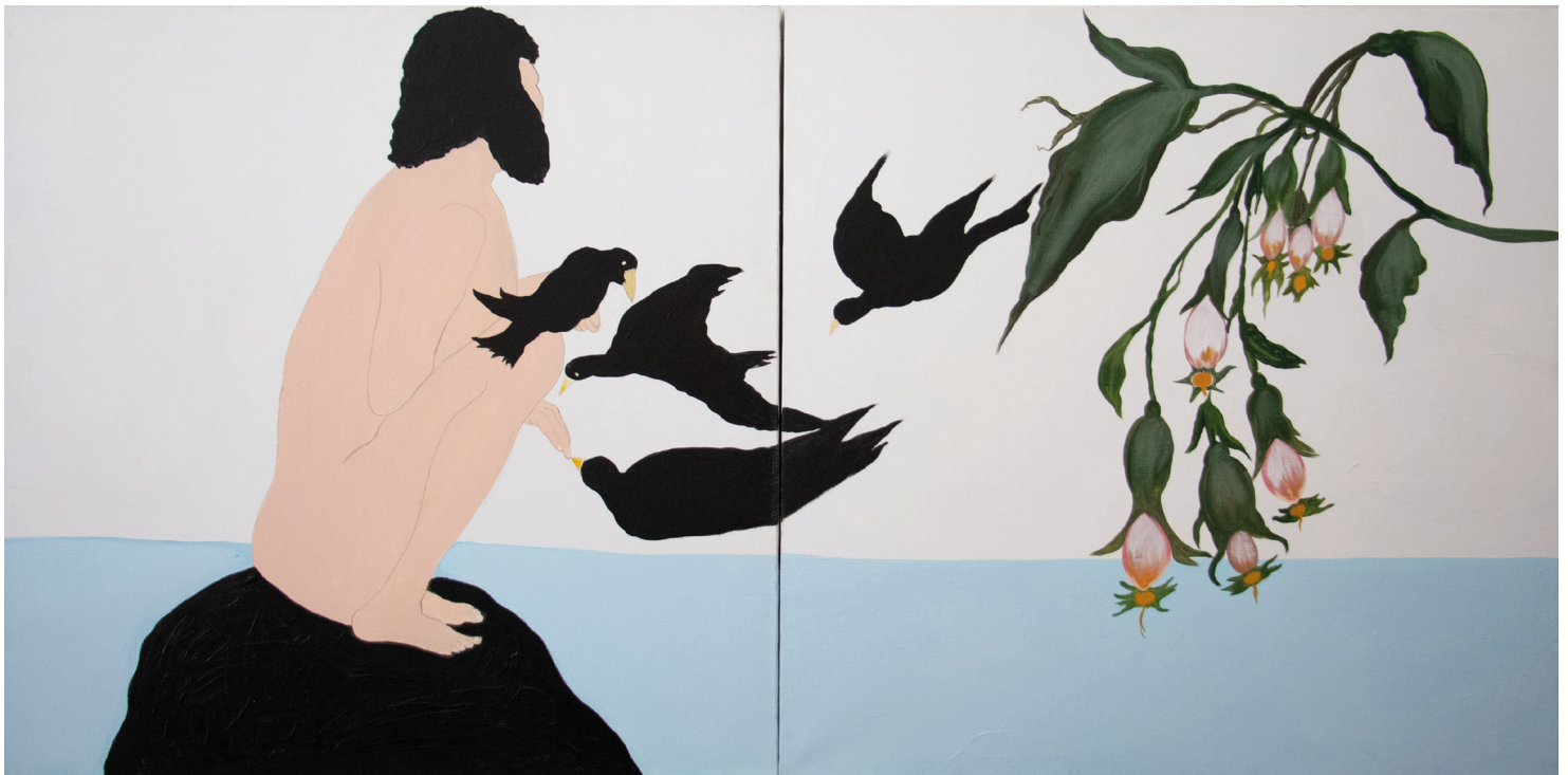
« Black birds », 2017, acrylique sur toile, 200 x 400 cm